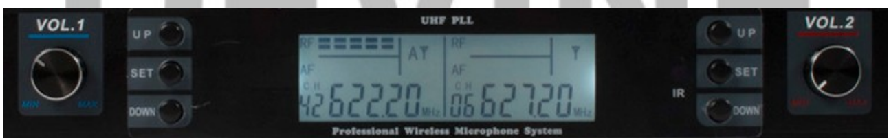
Indicatie van kanaal en frequentie op de WMD-168MKII ontvanger.

De WMD-168MKII-B bodypack is bedoeld om te gebruiken in combinatie met het Devine WMD-168MKII draadloze microfoonstelsel. Om deze bodypack aan te sluiten, houdt u de infraroodsensoren op zowel de ontvanger als het bodypack dicht bij elkaar en drukt u op de 'set' knop op het gewenste microfoonkanaal (1 of 2). Open indien nodig het batterijcompartiment om de sensorbelichting van het bodypack te vergroten. De apparaten worden nu gekoppeld op een geselecteerde frequentie die op de ontvanger gedefinieerd wordt. Als de synchronisatie is gelukt, licht het display van de bodypack op en worden het nieuw ingestelde kanaal en de frequentie weergegeven. Het display van de ontvanger geeft de signaalsterkte weer zoals aangegeven door 'RF'. Voor meer informatie over de ontvanger, zie de Devine WMD-168MKII gebruikershandleiding.