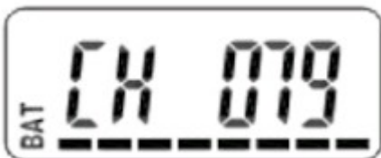
Indicatie van kanaal op de bodypack-zender.

De informatie in deze gebruiksaanwijzing kan gewijzigd worden zonder verdere notificatie.